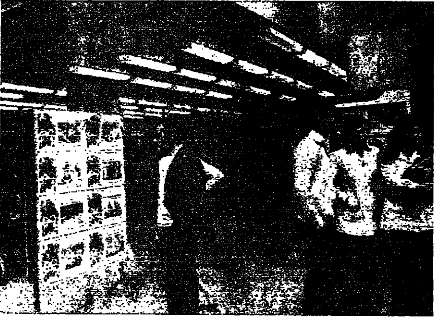
واقعه «عنترة...» !